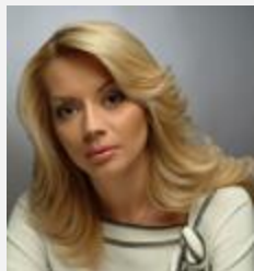
Daciana Sârbu COMISIA DE MEDIU, SĂNĂTATE PUBLICĂ ȘI SIGURANȚĂ ALIMENTARĂ PARLAMENTUL EUROPEAN

Festivitatea s-a desfășurat în prezența: