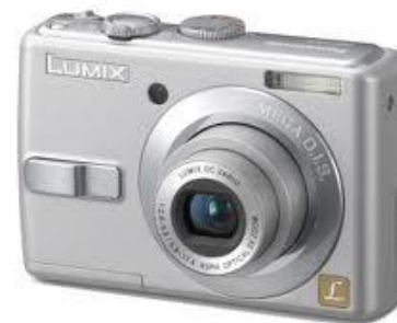
Aparat foto digital